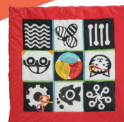
TAPIS D'ÉVEIL CONTRASTÉ FB302