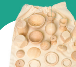
ENSEMBLE JOUETS D'ÉVEIL EN BOIS HOP106