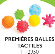
PREMIÈRES BALLES TACTILES HT2950